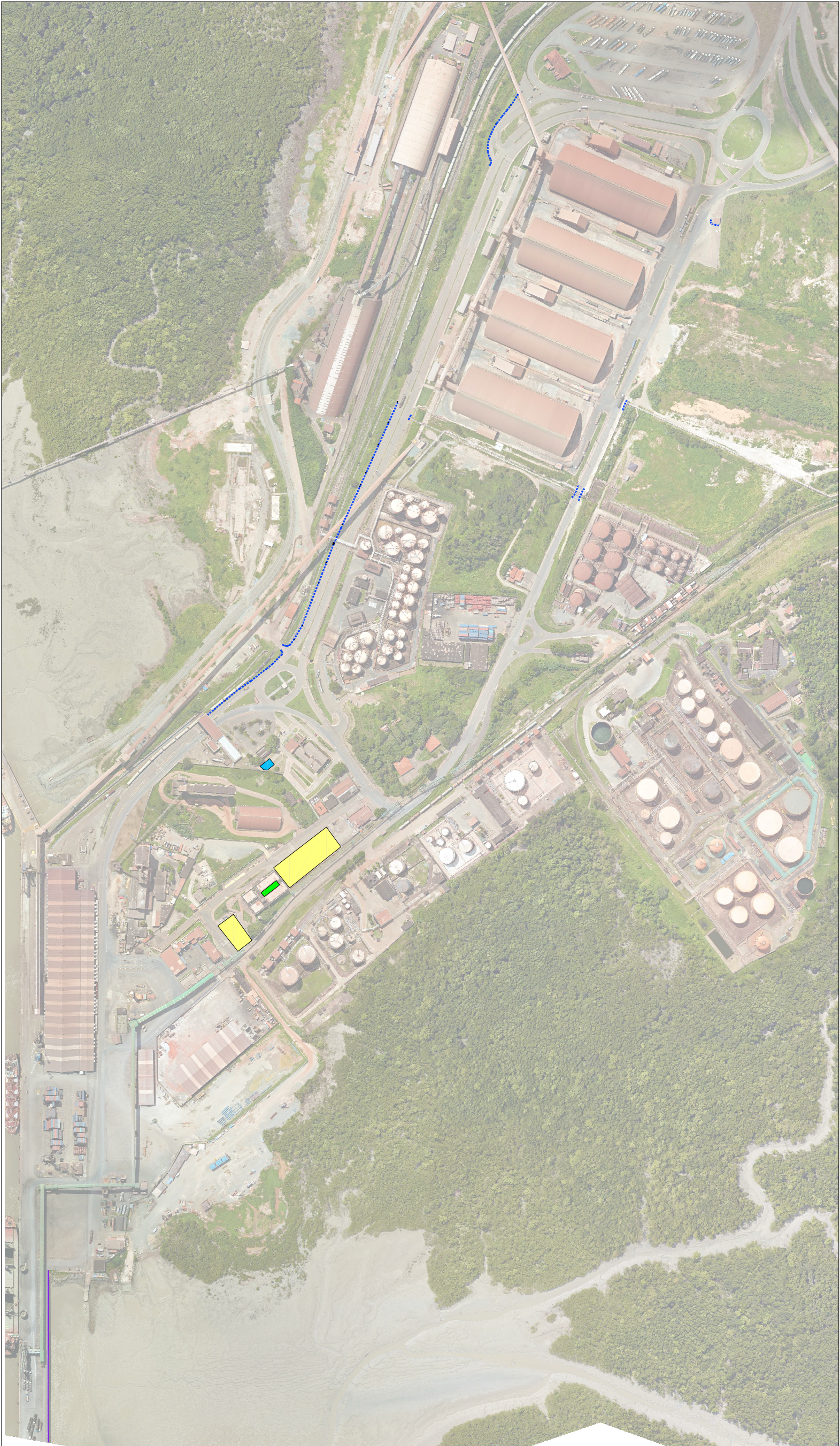
PLANTA DE LOCALIZAÇÃO DAS ÁREAS PARA ADEQUAÇÃO À SEGURANÇA DO TRABALHO SEM ESCALA